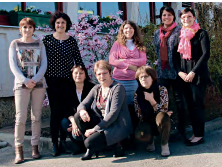
◆ Agentes administratives.