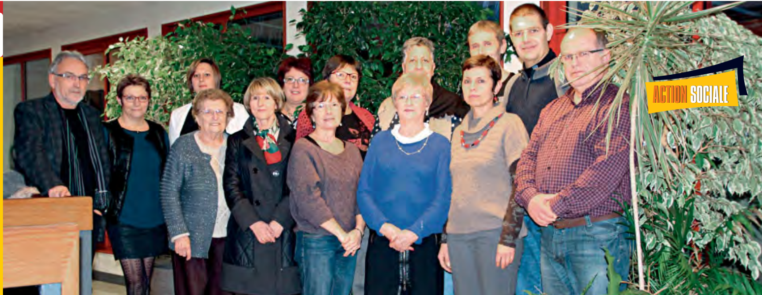
◆ Les membres du Conseil d'administration du CCAS.