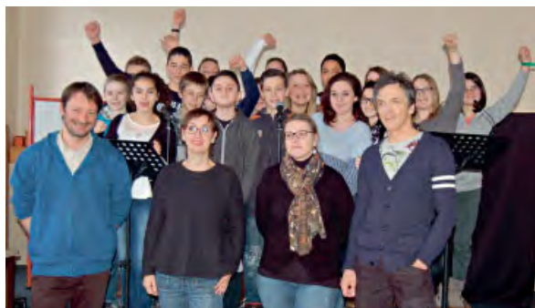
♦ Rencontre entre des collégiens et Enzo-Enzo.

une semaine, en compagnie de la chanteuse Enzo-Enzo et de son metteur en scène pour découvrir et jouer une pièce radiophonique en quatre jours, devant leurs camarades. Des classes de 6 e ont quant à elles, réalisé des kamishibais (théâtre japonais) pour des élèves de CM2 de l'école Paul Langevin.