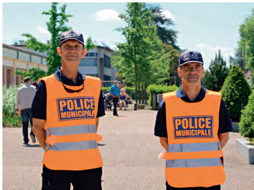
◆ Agents de surveillance de la voie publique.