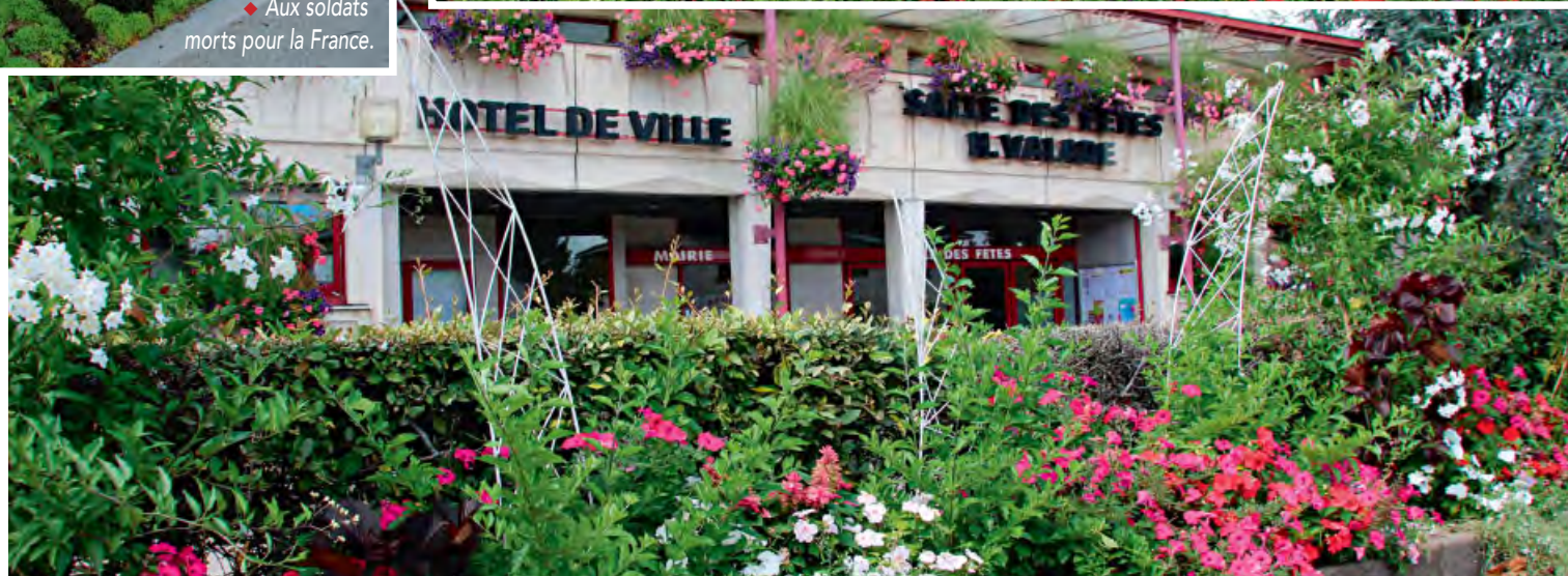
◆ La mairie a été primée au niveau départementale - catégorie bâtiment public.