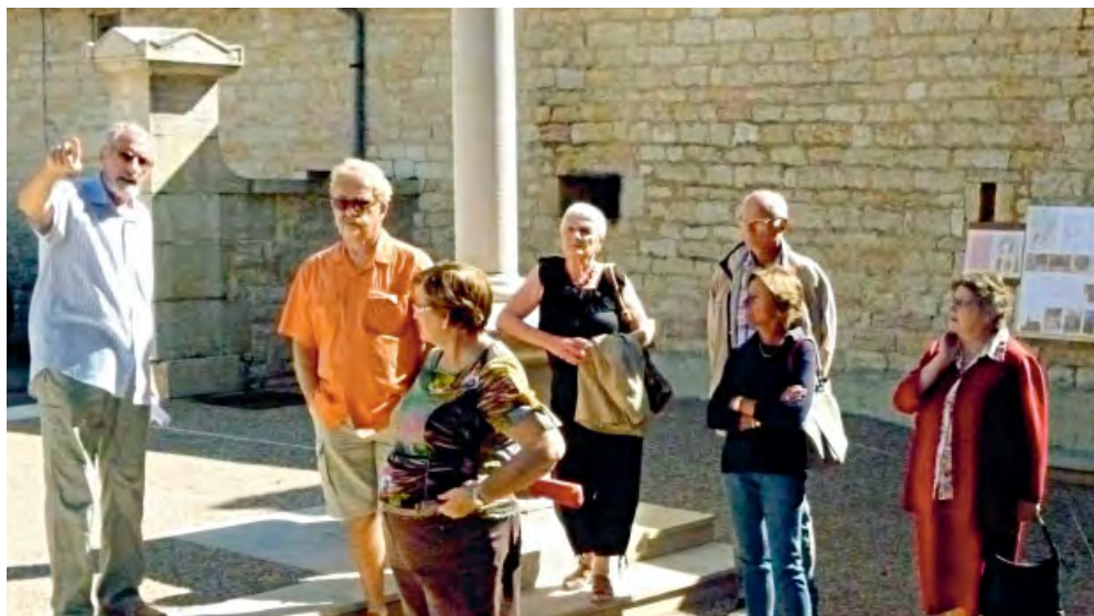
◆ Promenades découverte du patrimoine historique damparisien et des chemins pédestres balisés.