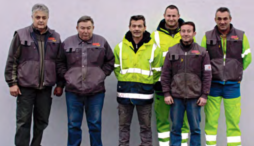
◆ Agents des services techniques.