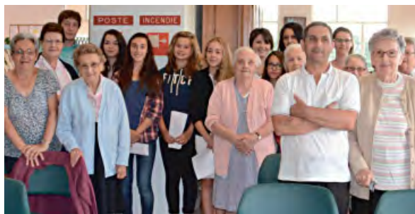
♦ Les élèves se sont produits au foyer du Val d'Amour pour la plus grande joie des résidents.

La chorale : dans le cadre de l'atelier chorale, d'autres élèves ont chanté pour les résidents d'un foyer logement pour personnes âgées.