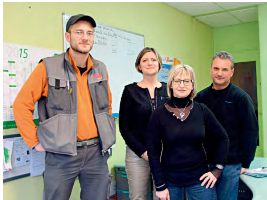
◆ Responsables, chefs d'équipe et secrétariat aux services techniques.