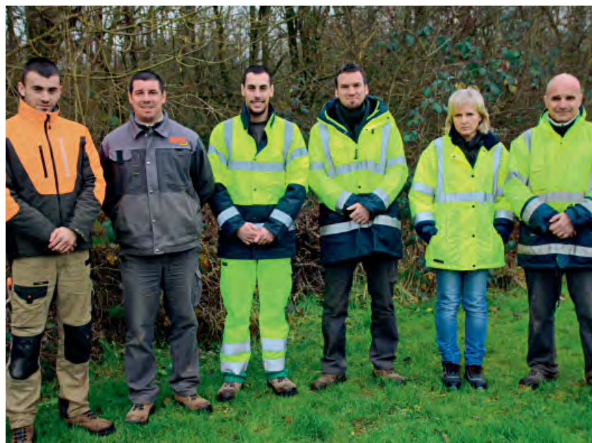
◆ Agents des services techniques.