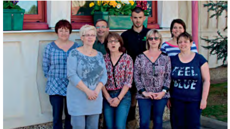
◆ Réunion du groupe d'agent-e-s.

Ces inégalités structurelles se retrouvent dans la répartition du temps de travail, puisque 100 % du personnel masculin travaille à temps complet et seulement 37 % du personnel féminin. 21 % des agentes travaillent à temps partiel et 42 % à temps non complet.