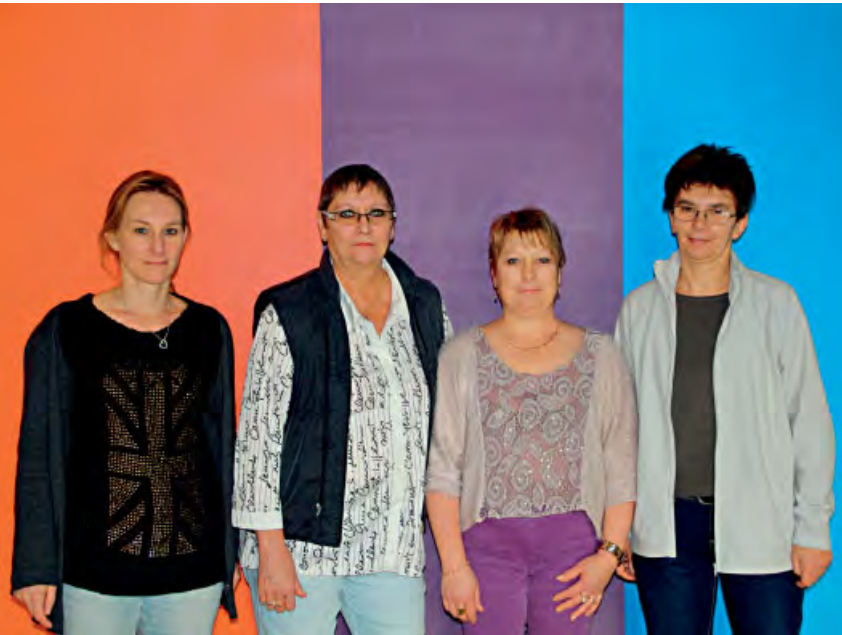
◆ Agentes territoriales spécialisées des écoles maternelles.