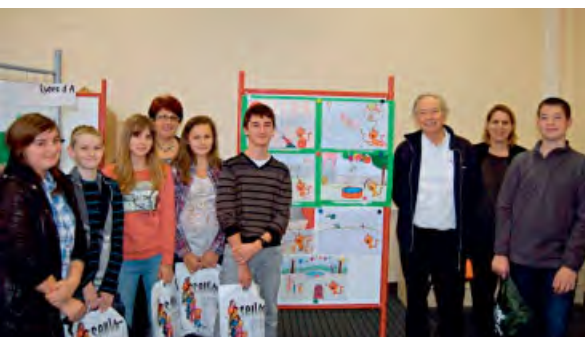
♦ Les élèves primés au concours BDmania, salon Suisse de BD.