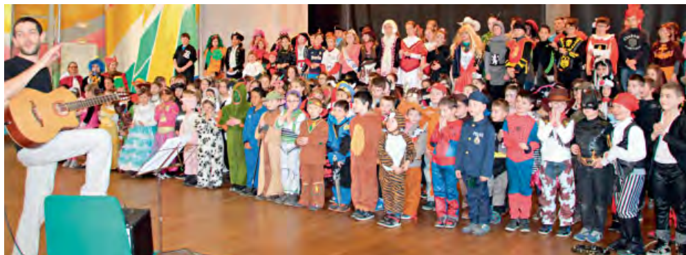
◆ Spectacle des écoles à l'occasion du carnaval. ▲ ◆ La classe de percussions lors du concert de Noël. ▼