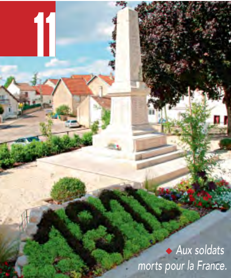
◆ Aux soldats morts pour la France.