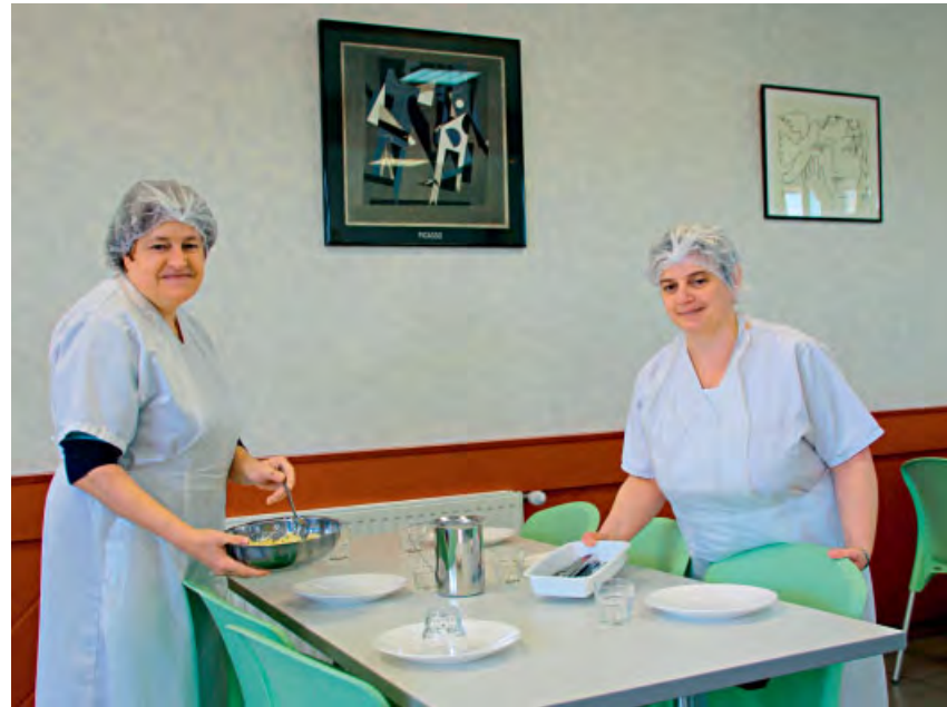
◆ Agentes en charge de la restauration scolaire.