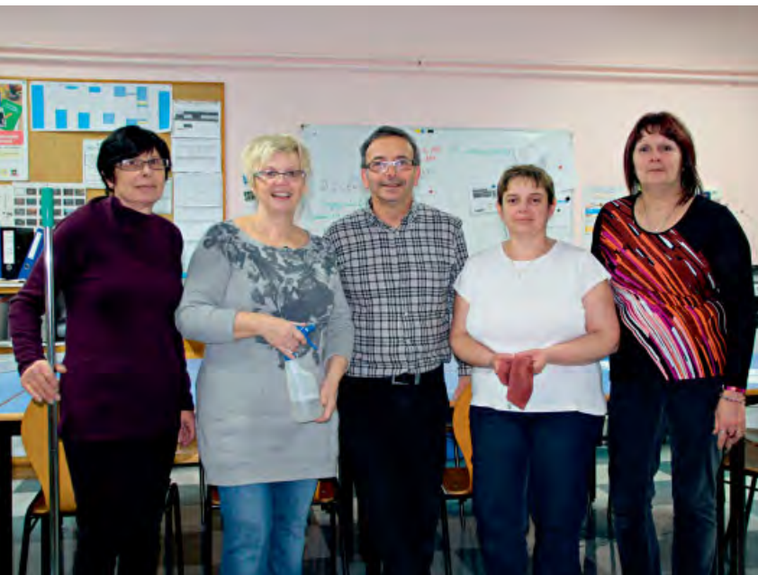
◆ Agent-e-s en charge de l'entretien des locaux.