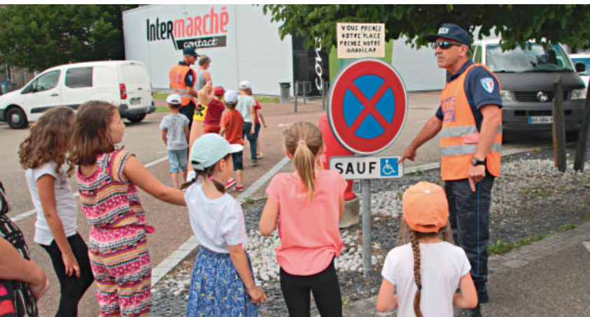
◆ Intervention dans les écoles de la commune des agents de police municipale dans le cadre de sensibilisation à la sécurité routière.