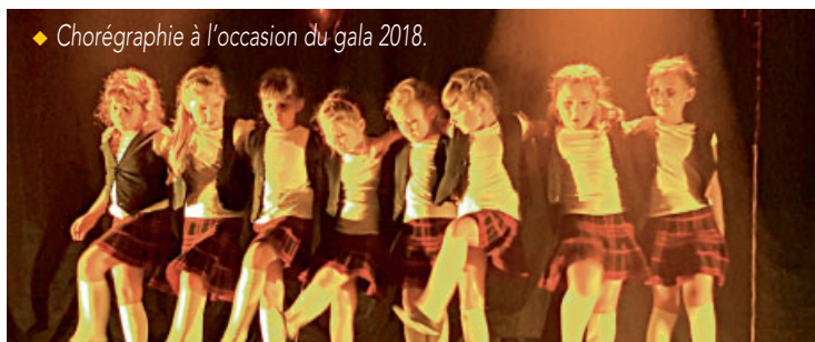
◆ Chorégraphie à l'occasion du gala 2018.

KS DAMP'S vous propose des cours de danse moderne, des cours de gym d'éveil et des cours de découverte multisport à partir de 5 ans, de la Zumba, du pilate, du metafit, du renforcement musculaire ainsi qu'une nouvelle activité le KS Jump (trampoline), proposée cette année les mercredi de 19 h à 20 h. Rejoignez-nous... Contactez Séverine Mendelski, au : 06 50 50 89 61.