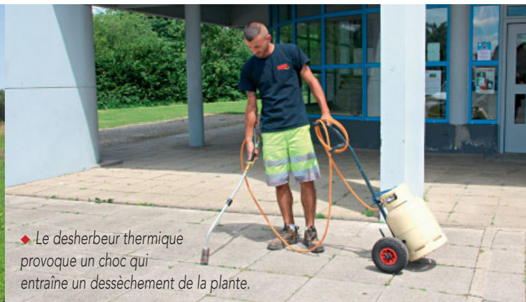
◆ Le desherbeur thermique provoque un choc qui entraîne un dessèchement de la plante.

Découvrir Damparis en beaux chemins... Plan-guide des circuits pédestres en cours de réalisation... Depuis 2012, le Conseil Consultatif s'est lancé dans le projet de création de quatre circuits de randonnée sur le territoire de la commune. La finalisation est en bonne voie et doit aboutir prochainement à la composition d'un document de présentation des itinéraires avec plan et détails historiques.