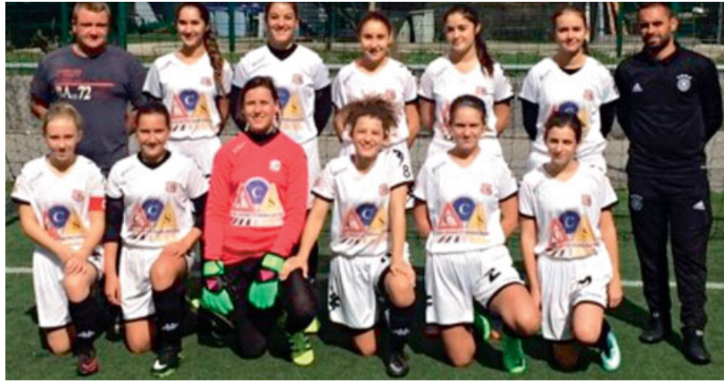
◆ Équipe féminine composée de jeunes filles âgées de 15 à 18 ans.

Football : fusion et naissance du club... Jura Stad'Football Club. En 2017, après une année de préparation, la Fédération française de football validait la fusion de nos trois clubs (le FC Damparis, le FC Abergement-la-Ronce et l'AS Saint-Aubin), en accord avec les différentes municipalités concernées. Nous souhaitons les remercier de tout le soutien dont elles ont fait preuve à notre égard. L'objectif de ce projet était simple, mutualiser les structures, les moyens sportifs, humains et financiers afin de pouvoir répondre aux obligations de la fédération et ainsi assurer la pérennité du football sur les trois communes tout en proposant un club de football structuré, attractif et compétitif. En cette fin de saison, le comité directeur du club est fier du chemin parcouru lors de cette première année : une deuxième place en championnat (départemental 1) et une place de finaliste en coupe du Jura pour nos seniors 1. L'objectif étant à court terme de retrouver le championnat régional 3.