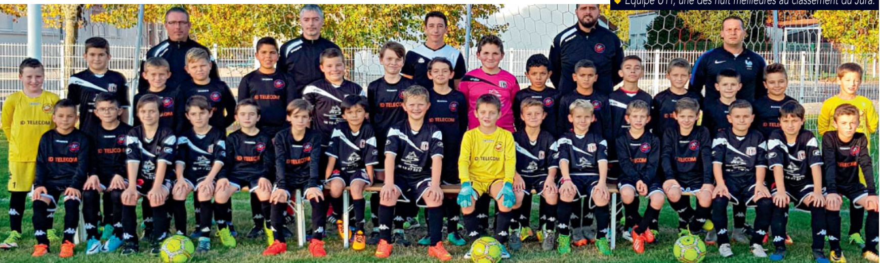
◆ Équipe U11, une des huit meilleures au classement du Jura.