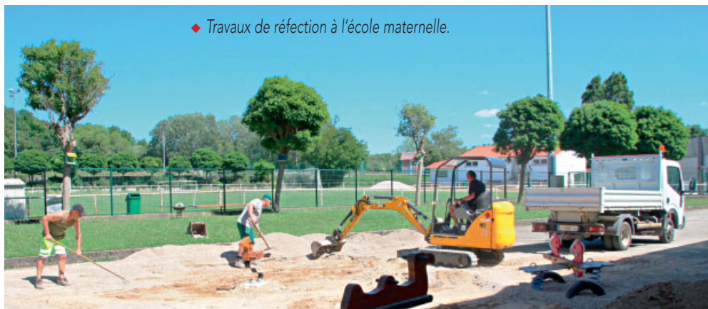
◆ Travaux de réfection à l'école maternelle.

Achat de deux desherbeurs pour 7600 €, un thermique et un mécanique, subventionnés à hauteur de 6 000 € par l'Agence de l'eau. Rénovation du chauffage au gymnase Auguste Delaune et à la salle des fêtes, pour 7000 €. École élémentaire : installation d'alertes, changement du sol du couloir, mise en accessibilité, modification chauffage, pour 57 900 €. Abri-Fitness installé au terrain multisports (derrière le collège) pour 16 000 €, subventionné à hauteur de : 2 660 € par l'État (Programme de dotation d'équipement des territoires ruraux). Remplacement éclairage public pour 26 000 € (suite des travaux engagés, 3 e tranche sur 6). Voirie : aménagement d'une zone 20 (rue du Soleil) : 110 000 €, poursuite du programme pluriannuel de travaux d'accessibilité aux personnes à mobilité réduite des voiries communales : 10 000 €, travaux sur trottoirs de gestion différenciée (Zéro-phyto), rue de Belvoie : 10 300 €.