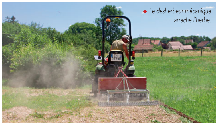
◆ Le desherbeur mécanique arrache l'herbe.

Une baisse de 31 % a été opérée sur les charges financières (renégociation des emprunts...). Malgré une baisse significative des recettes, due à la diminution des dotations de l'État (moins 400 000 € sur quatre ans), la commune met tout en œuvre pour maintenir des services de qualité à destination de la population.