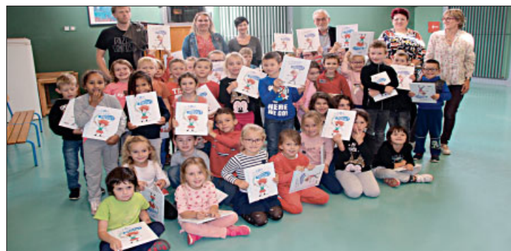
◆ Étaient présent-e-s : institutrices et personnel Ulis, conseillère pédagogique du secteur, représentantes des parents d'élèves ; maire et adjointe aux affaires scolaires.

Place aux livres ! Jeudi 3 octobre, le maire a remis un livre à chaque élève de CP. Cette initiative, a comme objectif de redonner toute sa place au livre. Prendre du plaisir à lire, à fréquenter les bibliothèques, à partager ses lectures avec sa famille et les autres élèves. Dans le cadre des actions citoyennes pour l'égalité entre les filles et les garçons développées par la Ville depuis 2014, un album double-face a été choisi cette année : un côté filles, un côté garçons, qui invite les enfants à être eux-mêmes, en respectant les autres et en apprenant à bien vivre ensemble.