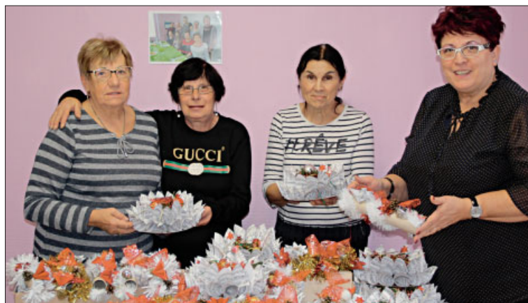
◆ Décorations de Noël réalisées par l'atelier créatif.

◆ Pour Noël, 128 colis individuels et 42 colis couples seront distribués et 90 personnes ont participé au repas du samedi 29 novembre, ce qui représente un budget total de 14 255 €.