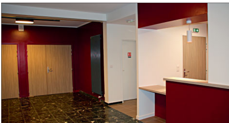
◆ Nouveau hall d'accueil à l'entrée de la salle des fêtes.

Subventions : dotations d'équipement des territoires ruraux : 53 000 € ; fonds de concours de la Communauté d'Agglomération : 10 000 € .