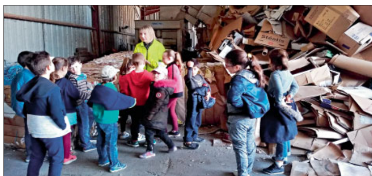
♦ Visite au Sictom.

Autres actions programmées : Animations rugby, contrôle des vélos par la Police municipale, spectacles Côté Cour, Scènes du Jura et JMF (jeunesses musicales), débats philosophiques et défi-lecture.