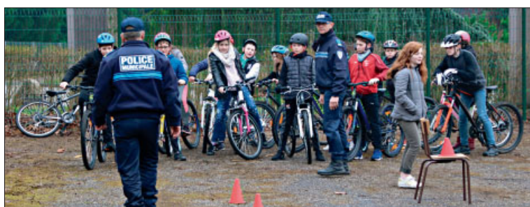
◆ Conduite en vélo : sensibilisation des élèves du collège par les agents de police municipale.

DES OBJECTIFS PRIORITAIRES : Le CISPD a été créé il y a plus de 20 ans avec Damparis, Tavaux et Abergement-la-Ronce. Aujourd'hui, en charge du Grand Dole, il est regroupé avec Dole. Les quatre communes travaillent en partenariat. Participent au bilan annuel de ce conseil les élu-e-s, la gendarmerie, la police, la justice, la préfecture et les chef-fe-s d'établissements scolaires. Pour 2018, le CISPD souligne la pertinence des actions menées et des résultats obtenus. Les objectifs prioritaires restent les actions de proximité et de prévention en direction des jeunes dans les écoles et collèges (sécurité routière, conduite à risques, sensibilisation sur les dangers d'internet) sans oublier tout ce qui concerne la tranquillité publique, les incivilités, les cambriolages... À noter que Dole, Damparis, Tavaux et Abergement-la-Ronce sont les seules communes du Grand Dole parties prenantes dans ce CISPD et possédant une police municipale. Avec un plus pour Damparis : nos deux policiers effectuent des astreintes de semaine et de week-end, bien que le périmètre de la commune soit couvert par la gendarmerie.