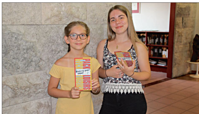
◆ Lors de la remise des packs loisirs jeunes.

◆ 120 cartes jeunes ont été offertes aux jeunes de la commune pour un coût de 840 €. 187 packs jeunes ont été remis aux 7-19 ans pour un montant total de 4 820 €.