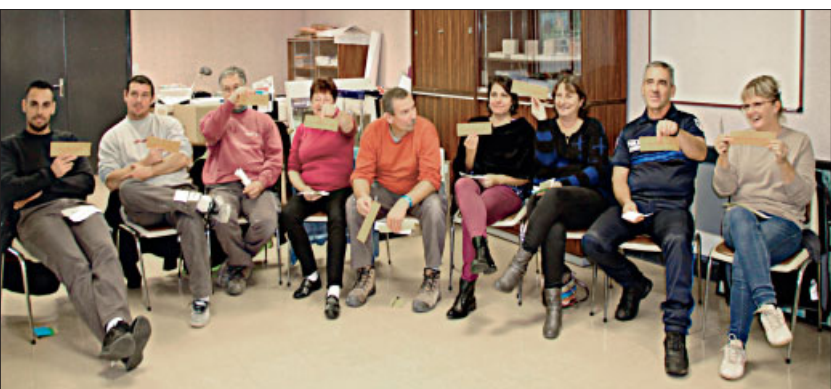
◆ Le personnel.

L'obligation de prévention pour un employeur consiste à assurer la sécurité et à protéger la santé physique et mentale de l'ensemble du personnel. Les agissements sexistes et le harcèlement sexuel au travail sont également des risques professionnels qu'il convient de prévenir. Ce fut l'objet de trois ateliers de sensibilisation organisés en interne en novembre pour les agent-e-s de la ville de Damparis.