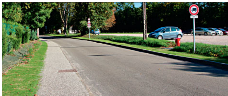
♦ Engazonnement des trottoirs rue du Moulin.

La municipalité poursuit son engagement initié avant l'interdiction des produits phytosanitaires (pesticides, désherbants...) sur les trottoirs de la commune et dans les allées des cimetières.