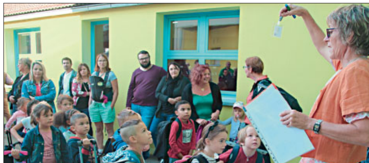
♦ Ambiance de rentrée pour les élèves.

Rentrée scolaire . La rentrée 2019 s'est faite en musique, en partenariat avec l'école de musique du secteur (l'EMTAD). Une façon chaleureuse et bienveillante d'accueillir les nouveaux élèves. L'école accueille 180 élèves : CP : 38 ; CE1 : 29 ; CE2 : 38 ; CM1 : 37 ; CM2 : 38. 11 élèves suivent une scolarité en ULIS (unités localisées pour l'inclusion scolaire) et sont répartis dans tous les niveaux.