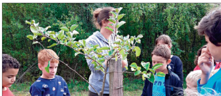
♦ Le verger des enfants.

Le projet de l'année... Le développement durable, abordé grâce aux thèmes de la biodiversité, de la nature et de l'environnement : apprendre en manipulant, en observant, en écoutant ce qui nous entoure. Partager ses découvertes avec les autres, apprendre à jardiner, comprendre le cycle de l'eau et ses problématiques, cuisiner et mettre à l'honneur les produits frais, naturels et locaux, limiter les déchets, recycler les emballages. Ces projets nouveaux qui complètent les actions conduites par le passé séduisent les enfants, soucieux de l'avenir de la planète.