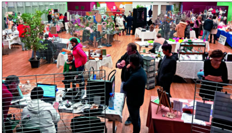
✓ Le salon s'est déroulé à la salle des fêtes le 19 mars 2023.

● Le salon Créations Passions a permis encore cette année de belles rencontres entre tous les invité-e-s. Des nouveautés qui ont ravi le public nombreux en fin de matinée et l'après-midi ; le Fab-Lab de Biarne a même enregistré de nouvelles adhésions. L'animation de l'atelier Poterie a permis à des enfants d'apprendre les premiers gestes du travail de la terre. Également la réalisation d'origami a permis d'initier quelques participants au pliage de papier. Notre objectif est atteint à intéresser le public au travail des artistes. Maintenant, il reste à l'équipe organisatrice à trouver de nouveaux talents pour l'année prochaine. Les artistes intéressé-e-s peuvent faire acte de candidature auprès de la mairie pour 2024.