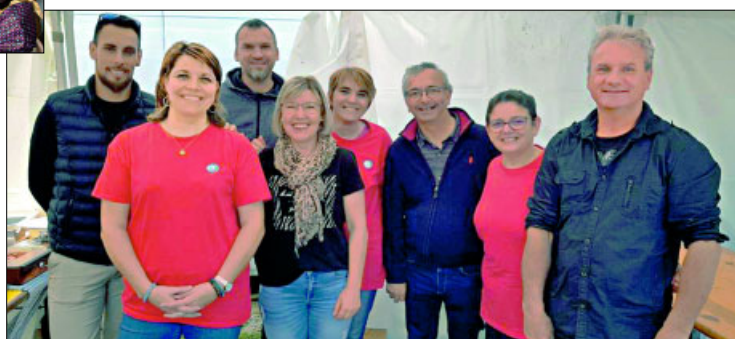
✓ L'amicale du personnel communal a tenu la buvette à Texte et Bulle.