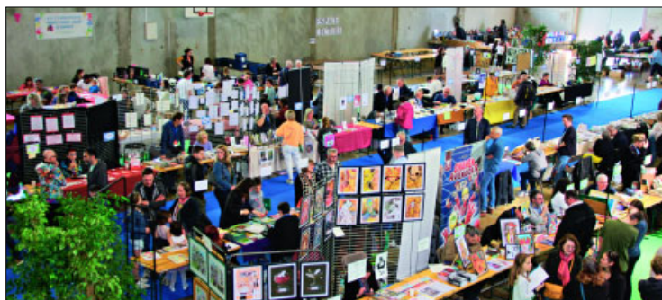
✓ Le salon a accueilli un nouveau public.