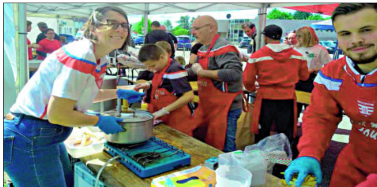
✓ Les bénévoles de l'école de rugby du Grand Dole ont servi plus de 120 repas et assuré la petite restauration.