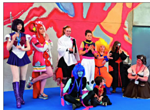
✓ Concours de déguisement, un vrai succès.